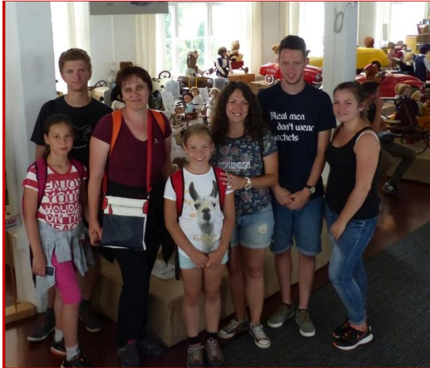
Einige Teilnehmer der Gruppe aus Ungarn mit ihrer Dolmetscherin (3.v.l.) vor historischen Kinderfahrzeugen

genau zur Halbzeit der Sommerschau 2017 konnten wir eine Gruppe aus Ungarn begrüßen und haben dazu außerhalb der regulären Zeiten am Montag geöffnet.