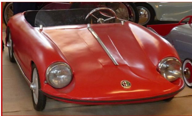
Tretauto „Alfa Romeo Spyder Super Sport“ Einzelanfertigung aus Italien für einen ungarischen Grafen um 1956

Schülerinnen und Schüler sowie Studentinnen und Studenten aus einer der Partnergemeinden von Gelenau nutzten die Gelegenheit, um einen Blick in die Spielzeugwelt vergangener Tage zu werfen. Die zweiundvierzig Jugendlichen im Alter von neun bis vierundzwanzig Jahren kommen aus Nagyhegyes und verbringen eine Woche im Erzgebirge. Die Partnerschaft besteht seit Dezember 2000. Nagyhegyes liegt am Rande der Pußta Hortobagy.